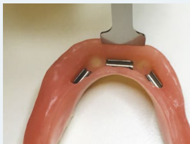
We helpen u graag bij het afstellen van de klemmetjes

Belangrijk om te weten: veel ziektes ontstaan in de mond. Uw prothese is erg gevoelig voor aanslag van eten en bacteriën en het is dus raadzaam deze zo goed mogelijk schoon te houden om hier eventueel uit voortvloeiende ziektes te voorkomen.