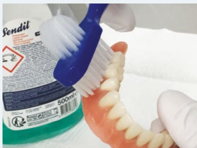
2-3 keer per dag reinigen met protheseborstel en zeep

Het is raadzaam de prothese 2 tot 3 keer per dag schoon te maken met een daarvoor bedoelde borstel en prothese reinigingsmiddel. Deze zijn bij de drogist te vinden. De prothese afspoelen nadat u iets gegeten heeft.